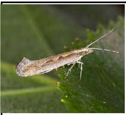
دودة الفراشة ذات الظهر الماسي