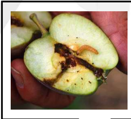
دودة ثمار التفاح