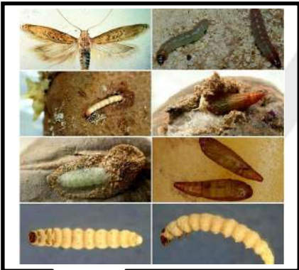
دودة درنات البطاطا