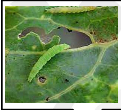
دودة الاوراق الخضراء