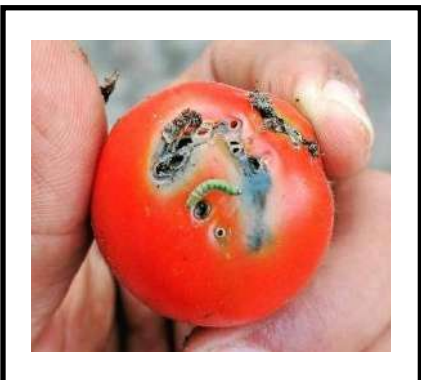
توتا ايسلوتا بالطماطم